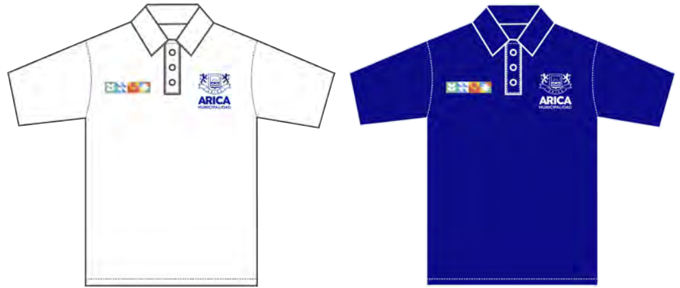
MODELO DE POLERA INSTITUCIONAL ALTERNATIVO